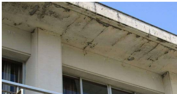
《内海小特別棟 コンクリート爆裂》