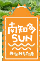
みなみちたちょう ゆうきやさいのうか まるやまのうえん 南知多町の有機野菜農家さん「丸山農園」

あんしん あんぜん ゆうきやさい そだ 安心、安全な有機野菜を育 てる土は、農薬や化学肥料で はなく、木くずや牛・豚のふ んを使っています。 みなみちたちょう こ 南知多町の子どもたちに おいしい有機野菜をたくさ ん食べてほしいです！