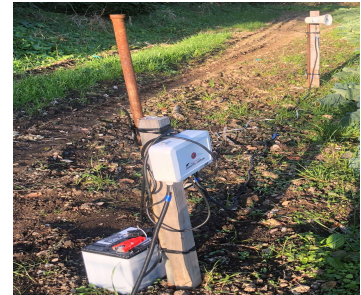
カラス撃退音声マシン