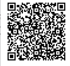
第2避難所等その他の情報はこちら

避難所の開設状況は、町公式ホームページ、町公式LINE、防災行政無線などでお知らせしますので、確認のうえ避難してください。