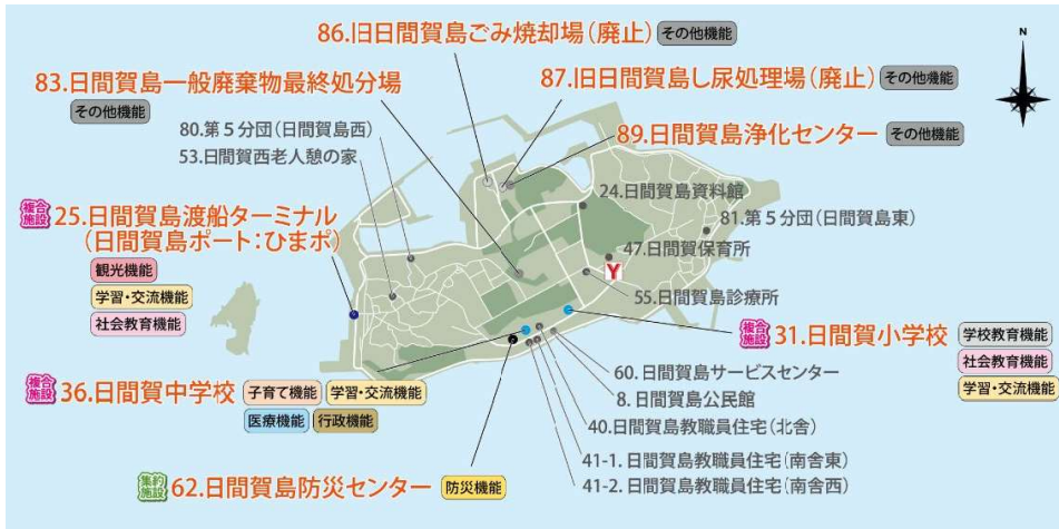
日間賀島地区 ▶▶ Aプラン