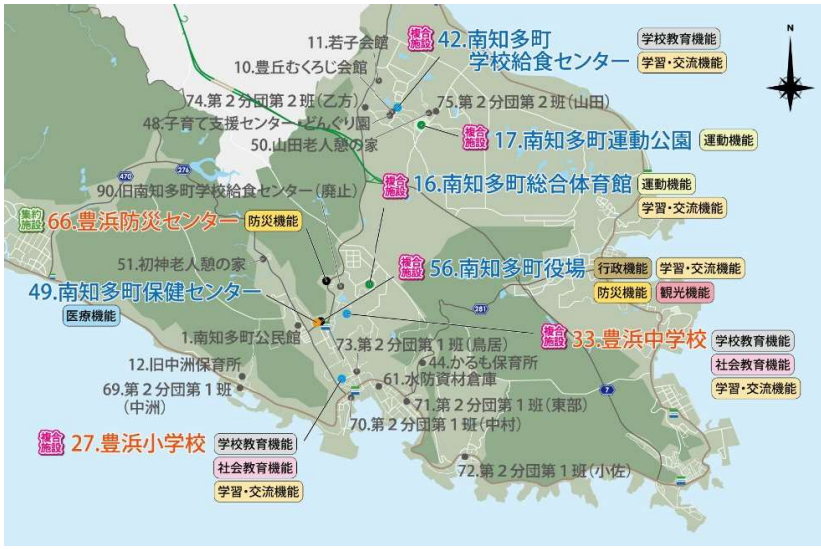
内海・山海地区 ▶▶▶ Aプラン