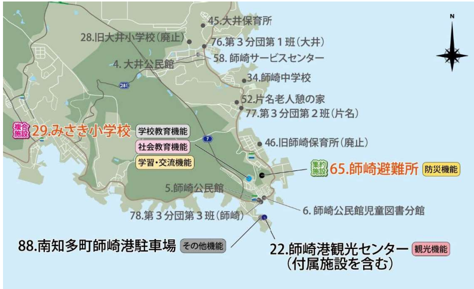
大井・片名・師崎地区 ▶▶▶ Aプラン