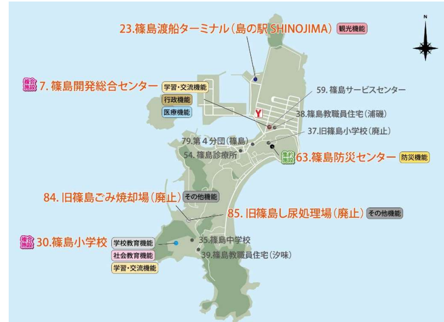
篠島地区 ▶▶▶ Aプラン