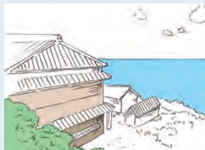
外壁を落ち着いた色合いにすることで海と馴染ませる

自然の風景に馴染む色を使う 海が見える自然の風景の一部となるように、落ち着いた色を使う。 海と馴染む素材を積極的に用いる 日よけにはパラソルでなく樹木を用いる。