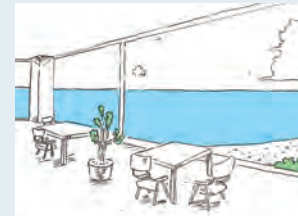
大きな窓で、海を楽しむ