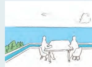
海とひとつながりの空間をつくる