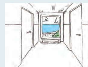
海の風景を取り込み、室内に奥行きを持たせる