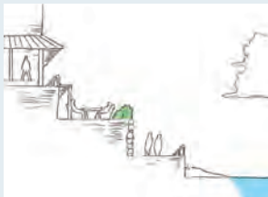
海への眺めはそのままに、道路側からの視線を遮る