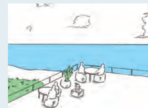
海の風景を独占できるようなスペースをつくりだす

シートの間隔を広めに空け、向きを少しずつ変える 視線が互いに交わらず、周りが気にならない。