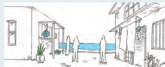
海が直接は見えなくても、海を感じられるものを路地に置いて、海らしさを演出する