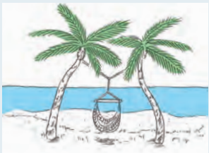
五感を使って海を楽しむ

海に向かって開放し、軒を深くしつらえる まるで海とひとつながりに感じられ、軒によって日差しからは保護される。 テラスを階段状に設置し、植栽で道路などから仕切る 歩行者と視線が交わらないよう緩やかに遮断。静かな環境を確保する。 ハンモックやブランコなど、揺れる滞在方法 海の風や音を全身で味わえる。