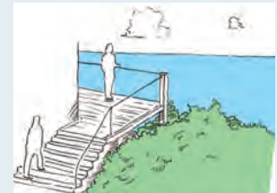
高低差を活かして、特別感を演出する