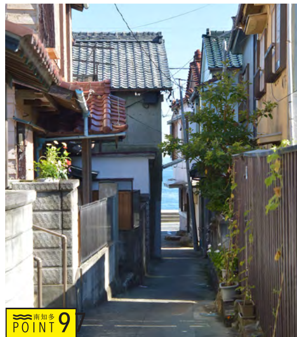
POINT 9 集落の狭い路地の先に大きな海が待っています。