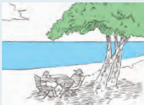
木陰など「自然」のものを活かす