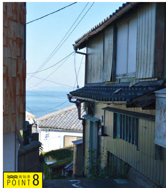
POINT 8 昔ながらの瓦屋根の先に海が望めます。