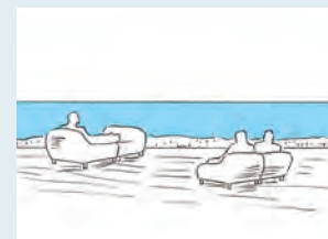
思い思いの姿勢でくつろぐことができる

寝そべったり深く座ることができ 自由なフアニチャアを置く くつろぎながら全身で風景を感じることができ