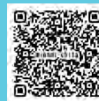
景観計画は こちらから