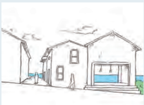
海への眺望をさえぎらない

一階をガラス張りにし、海へ抜ける 通路をつくる 道路から通路に沿って海の風景が見通せる。