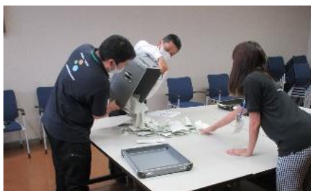
開票作業の様子（町役場にて）

最も得票の多かった「みさき」と2番目の「岬」の得票は「僅差」ではなかったため、事前の取り決めに従い、再投票は実施しません