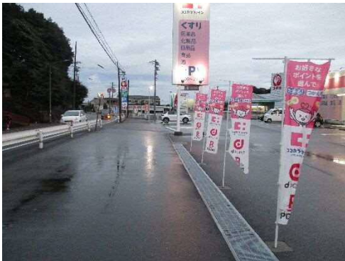
③ココカラファイン前