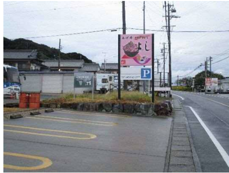
②あげ井C Y A Y Aよし前