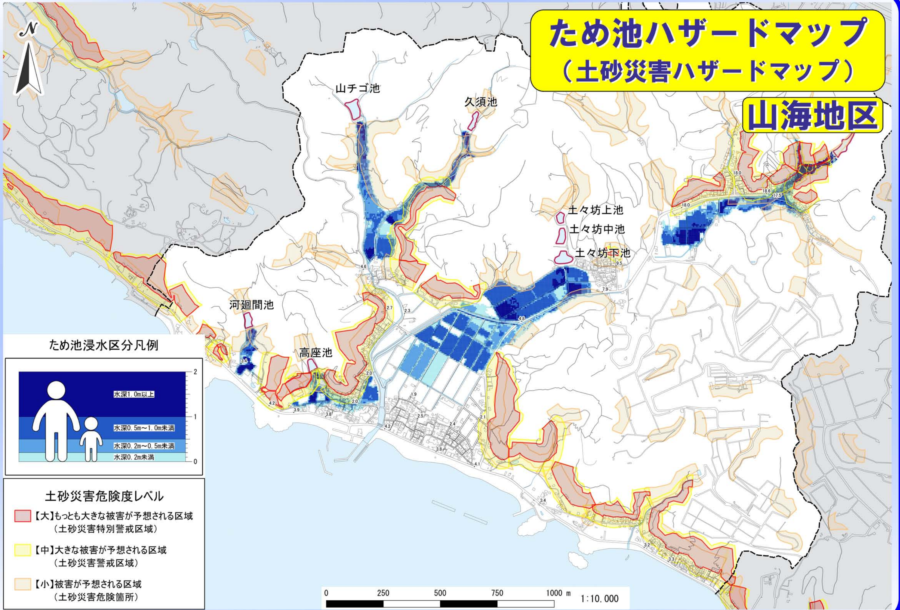
ため池浸水区分凡例