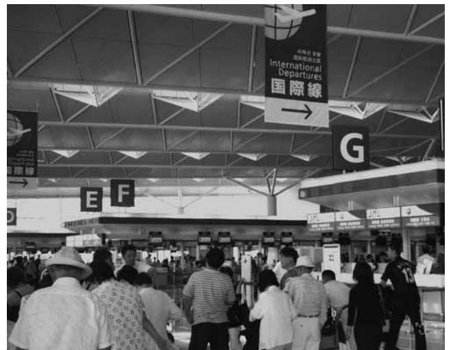
▲中部国際空港(セントレア)

本町は、東海4県の県・市町村からなる、東海地区外国人観光客誘致促進協議会に加盟しており、共同して外国人観光客誘致活動を行っている。平成18年には愛知県観光協会が行った外国人観光客誘致宣伝・誘客促進事業の海外プロ