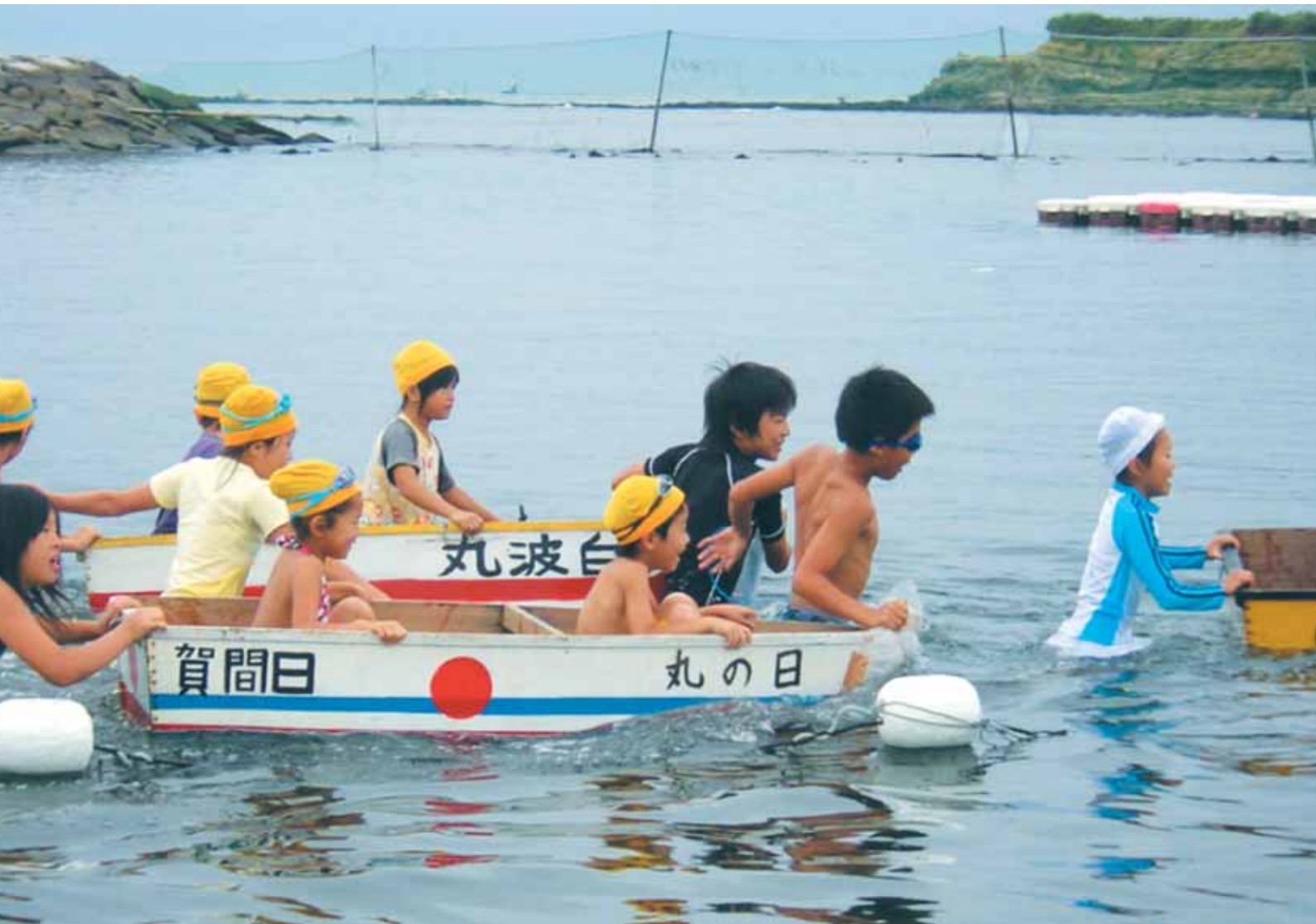
日間賀小学校の海に親しむ会