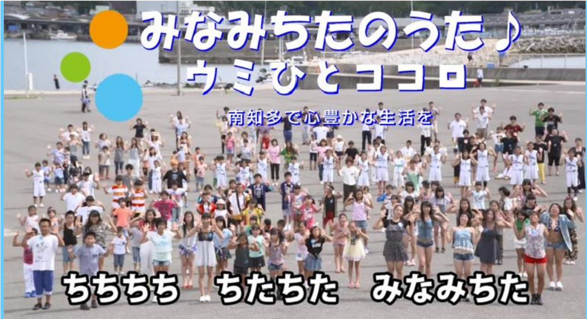
南知多町タウンプロモーション戦略策定委員会