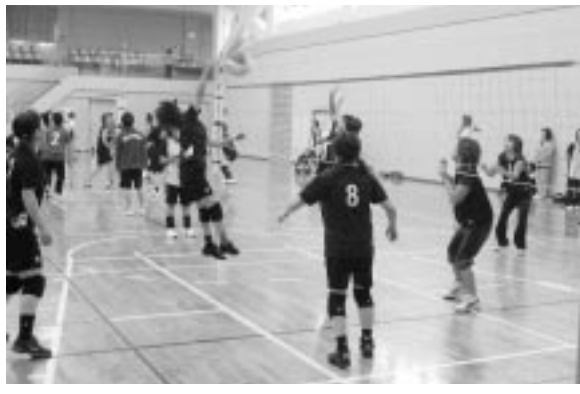
平成18年度スポーツクラブ登録状況（平成19年2月1日現在）