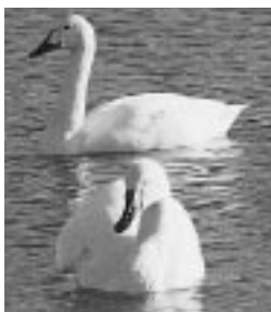
コハクチョウ昨年1月 常滑市樽水調整池

今後3羽は、本能に従って北をめざすことでしょう。その途上でオオハクチョウの群れの一つに出会い、無事北の国に連れ帰ってもらえるよう祈ってやみません。