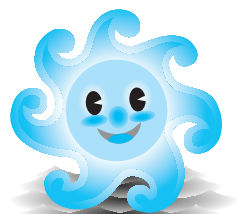
町のキャラクター ミーナ

8月12日、日間賀島東海水浴場で「たこまつり」が行われ、たこの供養祭や放流の後、日間賀小学校児童や水着姿の子どもたちが元気にたこみこしを担いでお祭りを盛り上げていました。