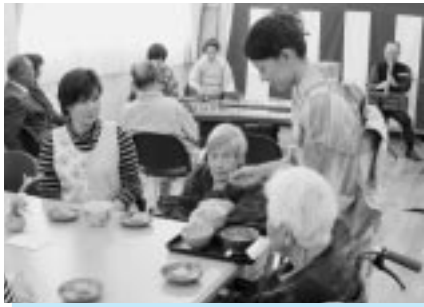
3 / 23 あい寿の丘お茶会