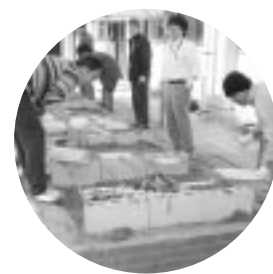
豊丘小名物ツイスト会食