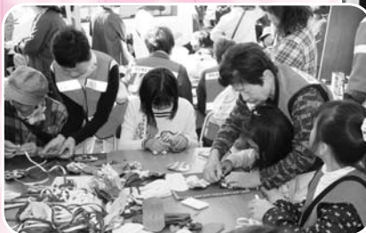
小物入れ作りに夢中