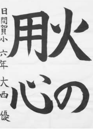
日間賀小6年 おおにし ゆう 大西 優