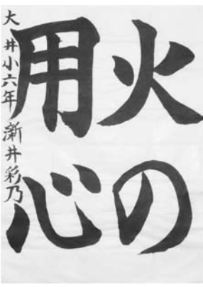
大井小6年 さらい あやの 漸井 彩乃