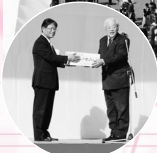
せんべい 八百津煎餅贈呈