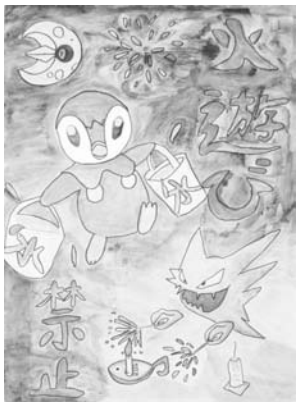
豊浜小6年 ひらお たかき 平尾 隆季