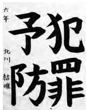
きたがわ ゆい 北川 結唯 (日間賀小6年)