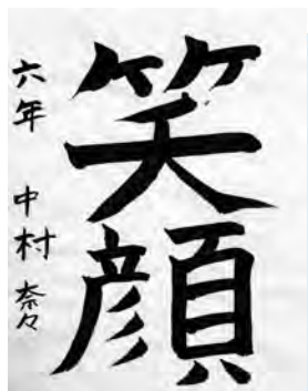
なかむら なな 中村 奈々 (篠島小6年)