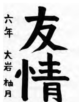
おおいわ ゆづき 大岩 柚月 (内海小6年)