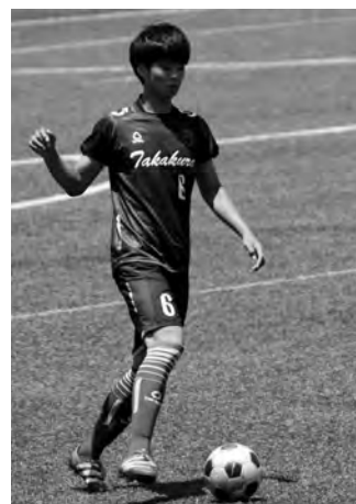
高蔵高校でサッカーをしている様子

全国高校総合体育大会(インターハイ)は、7月28日(金)に宮城県松島町文化観光交流館で開会式が行われ、翌29日(土)から仙台市のユアテックススタジアム仙台などの会場で熱戦が繰り広げられます。町民の皆さんも遠い空からではありますが、温かい応援をお願いいたします。