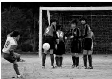
南知多 SSS 時代(写真・右)