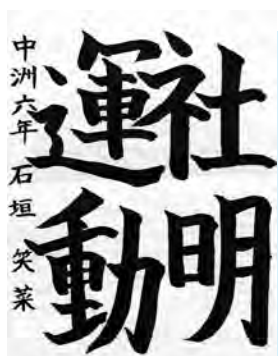
いしがき えな 石垣 笑菜 (豊浜小6年)