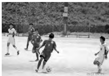
内海中学校時代(写真中央)