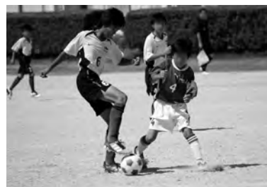
南知多 SSS 時代(写真・中央左)