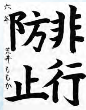
あらい 荒井ももか (師崎小6年)