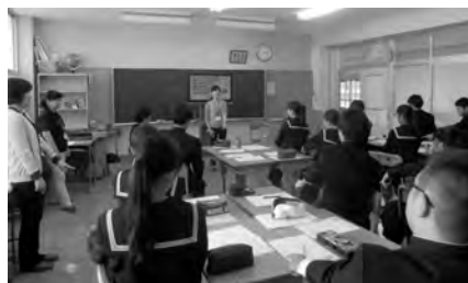
(内海中学校・頭の体操の様子)