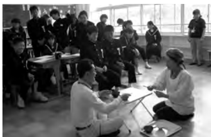
(師崎中学校・寸劇の様子)