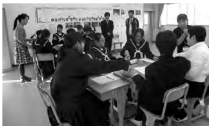
(篠島中学校・頭の体操の様子)