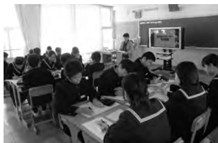
(豊浜中学校・グループワークの様子)