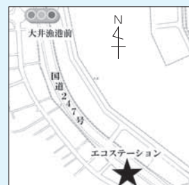
▲エコステーションの場所