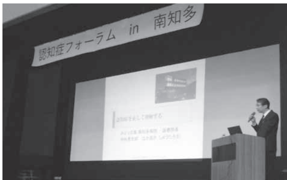
〈仲秋先生の講演風景〉