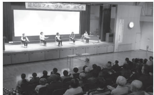
〈コグニサイズの様子〉