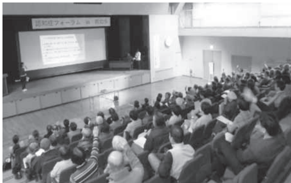
〈認知症についてクイズ形式で学びました〉