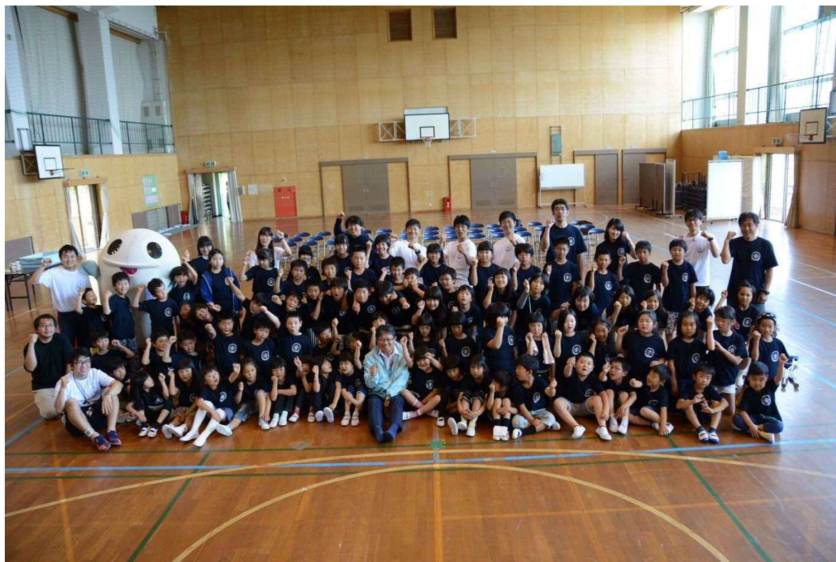
篠島小学校で「篠島ウミガメ隊」結団式