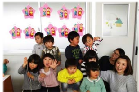
作ったおひなさまを飾って、はいポーズ！！