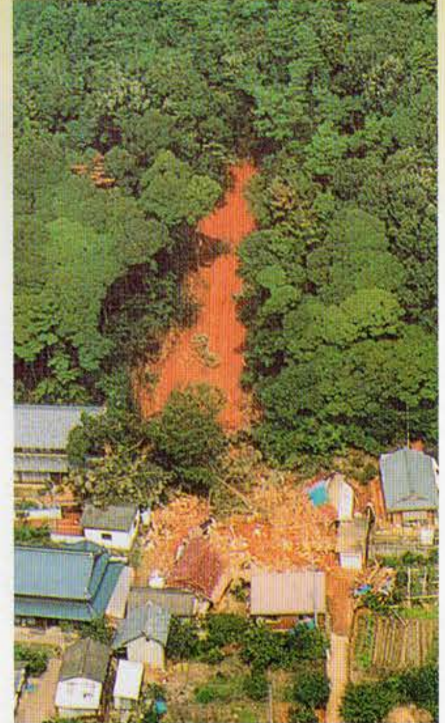
● 急傾斜地の崩壊(かけ崩れ) 平成12年 小牧市大字大山