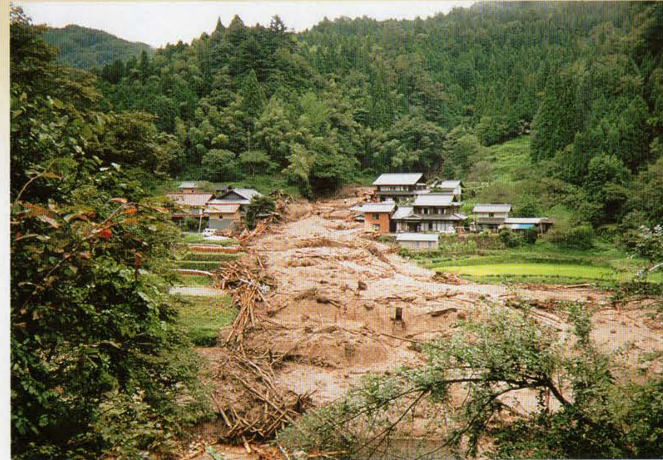
● 土石流 平成12年 河上瀬川(豊田市)