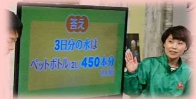
TVで防災コーナー出演